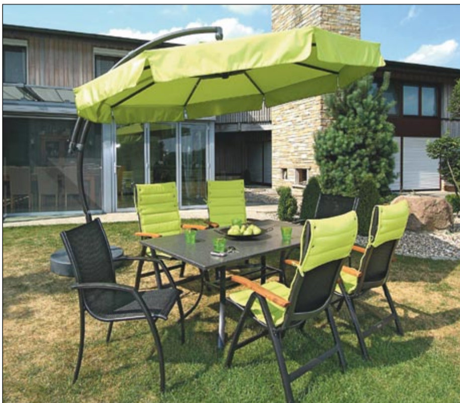
Wygoda i funkcjonalność Alu Sun Star Comfort

- Główną gałąź naszej produkcji stanowią meble ogrodowe oraz elementy wyposażenia wnętrza, takie jak poduszki i artykuły ozdobne - zasłony, firany, maty na stół i serwetki. Produkcja mebli ogrodo-