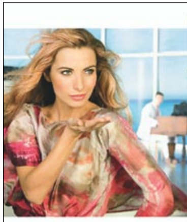
Bogactwo wzorów drzwi marki Classen-Pol