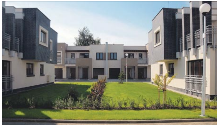
Mieszkania przy Alei Ludwinowskiej - bliźniacza zabudowa w willowej okolicy

standardom. Między innymi dlatego prowadzimy 3-etapowy odbiór naszych mieszkań. W przypadku wykrycia jakichkolwiek nieprawidłowości niezwłocznie przystępujemy do ich usunięcia. Klient wprowadza się więc